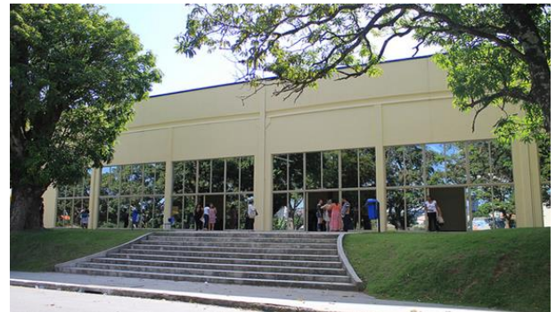
Vista principal da entrada de acesso ao Auditório