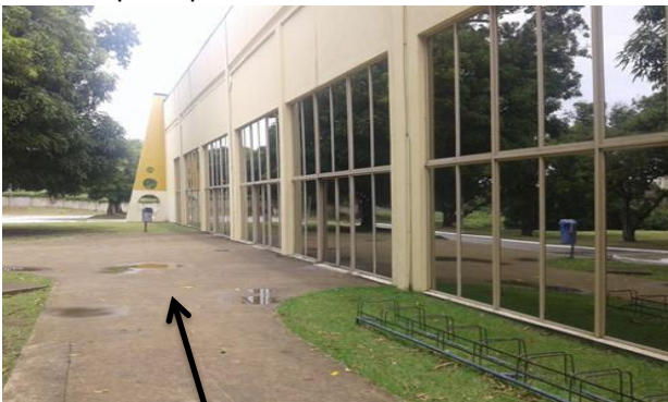
Rampa lateral de acesso para cadeirantes