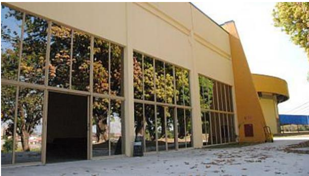
Entrada principal do Auditório do SEDES Taubaté